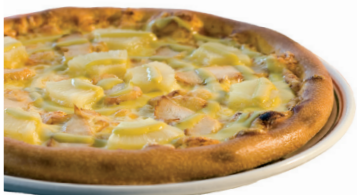
120. Pizza Chicken Curry mit Hähnchenfleisch und Ananas in pikanter Curry-Sauce k 12,00 • m 16,00 • g 25,00 • P 36,00