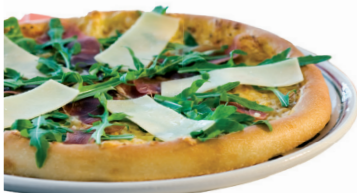
126. Pizza Italia mit Parmaschinken, Rucola und Parmesan 2,3,7