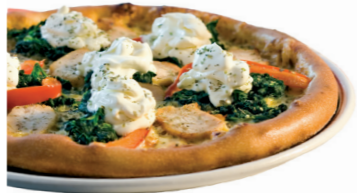
122. Pizza Miami mit Hähnchenbrust, Paprika, Blattspinat, Knoblauch und Crème fraîche 7 k 12,00 • m 16,00 • g 25,00 • P 36,00