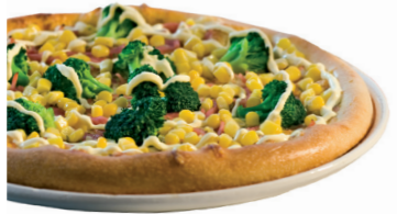
121. New Pierre mit Schinken 2,3,4,14 , Mais, Brokkoli und Sauce Hollandaise k 12,00 • m 16,00 • g 25,00 • P 36,00