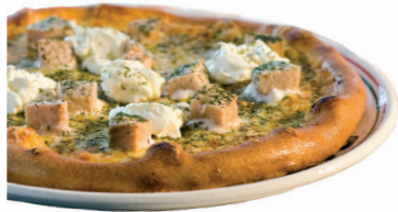
119. Pizza Alaska mit Lachs, Crème fraîche und Dill-Spitzen